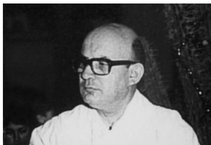
Un ritratto di monsignor Angelelli